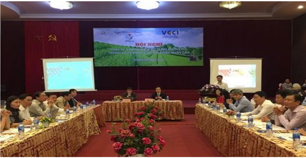
Hội thảo “Chia sẻ kinh nghiệm sử dụng Chỉ số PCI trong hoạt động của HĐND” khu vực phía Bắc (22/11/2018)

Tham dự Hội nghị có gần 100 đại biểu là đại diện lãnh đạo Hội đồng nhân dân các tỉnh: Thái Nguyên, Điện Biên, Hải Dương, Sơn La, Yên Bái, Phú Thọ, Tuyên Quang... các đại biểu khách mời từ các tỉnh Đồng Tháp và Quảng Trị; chuyên gia và lãnh đạo các Ban Hội đồng nhân dân các tỉnh. Tại Hội nghị, các đại biểu đã nghe các chuyên gia giới thiệu về PCI trong việc góp phần cải cách, cải thiện chất lượng môi trường kinh doanh cấp tỉnh, thúc đẩy các nỗ lực nâng cao năng lực cạnh tranh; tăng cường tiếng nói doanh nghiệp; khả năng sử dụng và khai thác dữ liệu PCI và các tham luận của Hội đồng nhân dân các tỉnh: Thái Nguyên, Đồng Tháp, Điện Biên, Quảng Trị về kinh nghiệm sử dụng chỉ số PCI trong hoạt động giám sát, chất vấn và ban hành chính sách ở mỗi