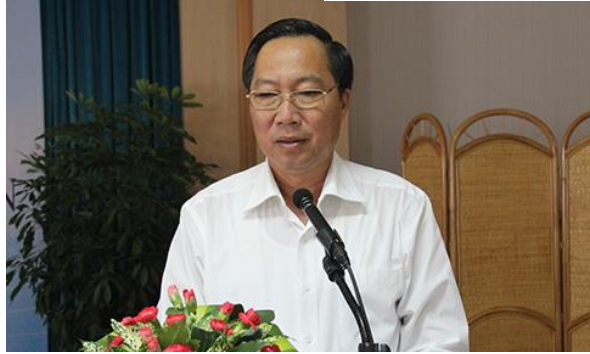
Ông Nguyễn Quốc Ca – Phó Chủ tịch Hội đồng nhân dân tỉnh Hậu Giang

được, chưa làm được của tỉnh BRVT trong việc phục vụ doanh nghiệp, cải thiện môi trường đầu tư, nhưng bức tranh chung và xu thế biến đổi của chỉ số PCI trong những năm qua, đã cung cấp những thông tin tham khảo rất có ý nghĩa đối với sự chỉ đạo, điều hành của lãnh đạo tỉnh BRVT. Đặc biệt đối với HĐND, 10 chỉ số thành phần trong báo cáo chỉ số PCI là một công cụ, là thước đo giúp ích rất lớn trong công tác giám sát việc thực hiện các Nghị quyết của HĐND; thẩm tra, đề ra chính sách phù hợp trong Nghị quyết phát triển kinh tế - xã hội của tỉnh hàng năm.”