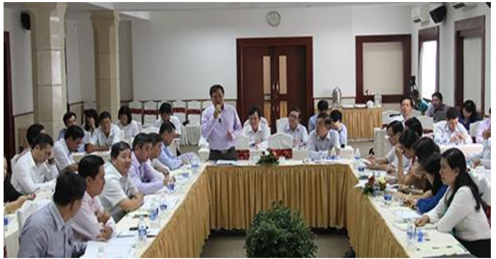
Hội thảo “Chia sẻ kinh nghiệm sử dụng Chỉ số PCI trong hoạt động của HĐND” khu vực phía Nam (16/11/2018)

Phải chăng từ các nguyên nhân trong thực thi pháp luật về đất đai, về các thủ tục hành chính, về sự quan tâm của các ngành trong tham mưu, đề xuất giải quyết các khó khăn vướng mắc của doanh nghiệp...Do đó thông tin phản hồi từ các doanh nghiệp là rất cần thiết, nhất là doanh nghiệp tư nhân để từ đó có những thông tin, nghiên cứu để quyết định và giám sát việc thực hiện chính sách cho phù hợp với địa phương mình. Đại biểu HĐND các địa phương khác như Phú Yên, Bình Phước cũng cho biết đã tích cực tổng hợp khó khăn, vướng mắc của doanh nghiệp trên địa bàn tỉnh, sử dụng PCI vào hoạt động ban hành nghị quyết, tham mưu cho UBND tỉnh chỉ đạo giải quyết. Tuy nhiên, một số đại biểu tại hội nghị cho rằng, việc sử dụng chỉ số PCI trong hoạt động của HĐND hiện nay còn gặp nhiều khó khăn; việc sử dụng chỉ số PCI trong hoạt động giám sát chuyên đề của HĐND tại các địa phương vẫn còn mờ nhạt. Cũng theo các đại biểu,