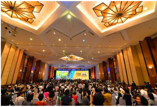
Toàn cảnh lễ công bố