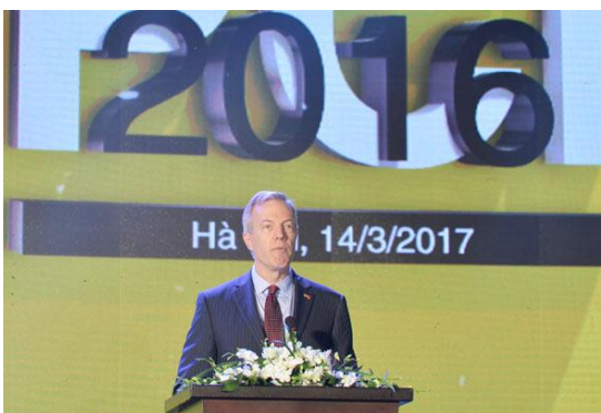
Đại sứ Ted Osius – Đại sứ Hoa Kỳ tại Việt Nam

Đây là lần thứ 12 liên tiếp VCCI công bố bộ chỉ số đánh giá và xếp hạng về chất lượng điều hành kinh tế của các tỉnh, thành phố tại Việt Nam. Bộ chỉ số đã giúp các địa phương đẩy mạnh khai thác môi trường kinh doanh, tích cực làm việc với cộng đồng doanh nghiệp, đổi tác từ đó có những cải thiện và cách làm sáng tạo để nâng cao thứ tự xếp hạng.