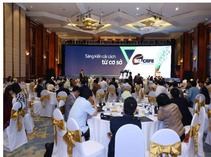
Toàn cảnh Buổi Cà phê Doanh nhân – Sáng kiến cải cách từ cơ sở

(Chi tiết bài viết, xem tại http://vietnamba.org.vn/tin-bai/su-kien-noi-bat/bizcafe---sang-kien-cai-cach-tu-co-so.html )