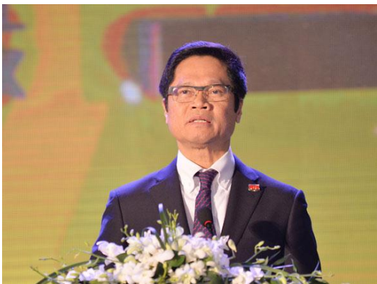
TS Vũ Tiến Lộc – Chủ tịch Phòng Thương mại và Công nghiệp Việt Nam (VCCI)