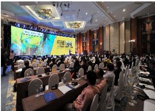
Đại biểu, khách mời tham dự chương trình