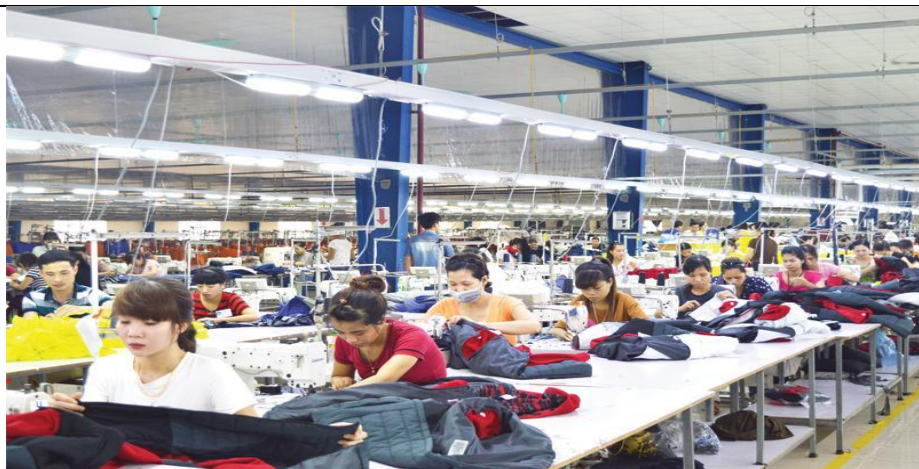
Dây chuyền may của Công ty Desung Global (Cụm công nghiệp Thịnh Hưng, huyện Yên Bình, tỉnh Yên Bái)