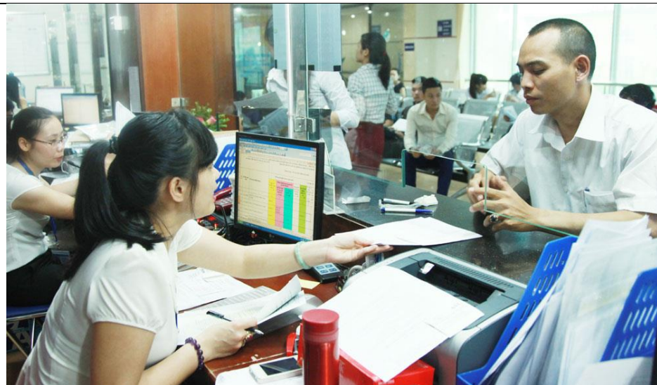
Giải quyết thủ tục Đăng ký kinh doanh cho doanh nghiệp tại Sở KH&ĐT Hà Nội.