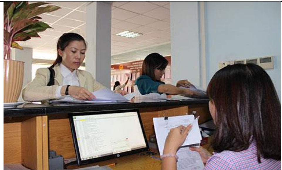
Bộ phận "một cửa" của Cục Thuế tỉnh Đồng Nai.