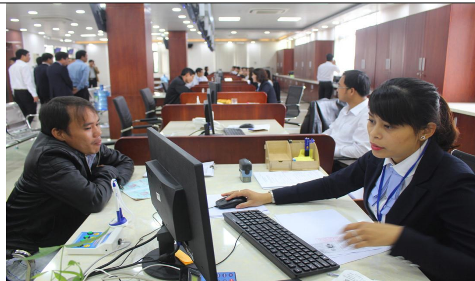
Trung tâm Hành chính công và xúc tiến đầu tư Quảng Nam trở thành địa chỉ tin cậy để người dân và doanh nghiệp đến giao dịch