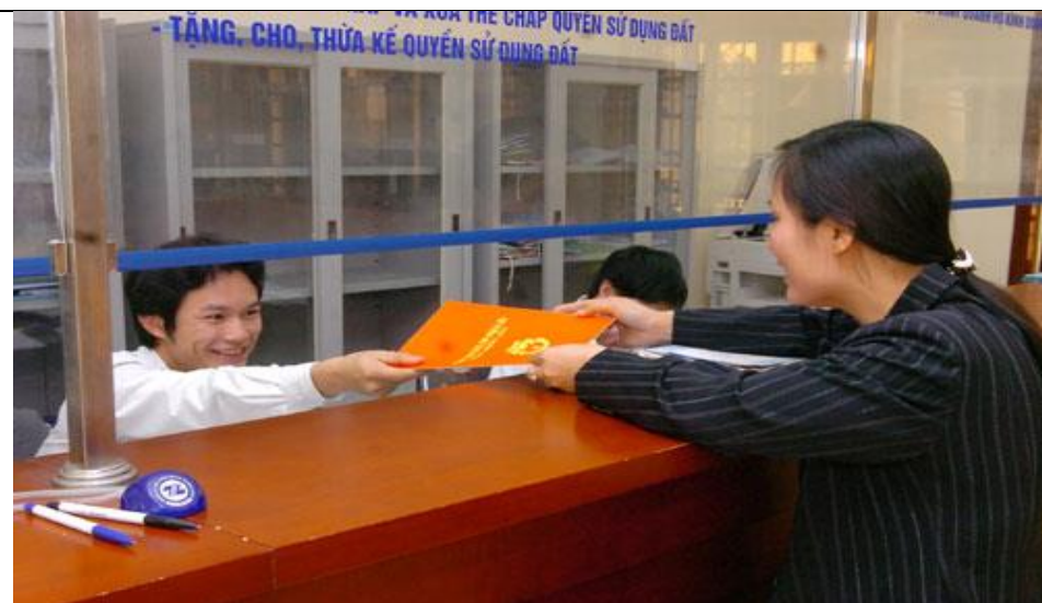
Người dân làm thủ tục cấp giấy chứng nhận quyền sử dụng đất tại bộ phận "một cửa" UBND thị xã Sơn Tây.