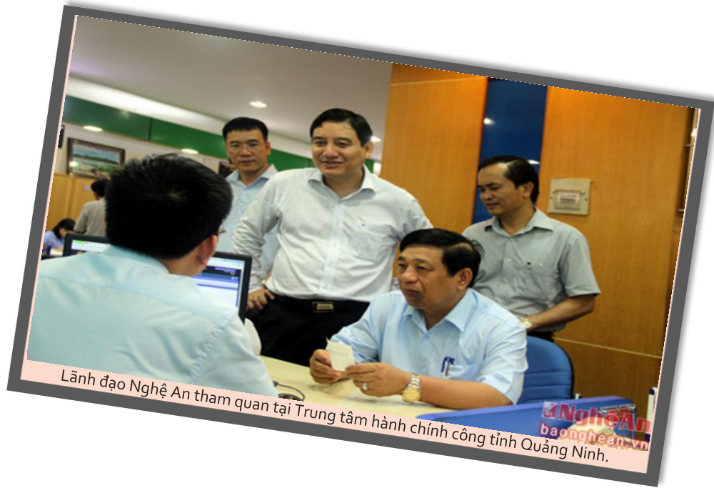
Lãnh đạo Nghệ An tham quan tại Trung tâm hành chính công tỉnh Quảng Ninh.