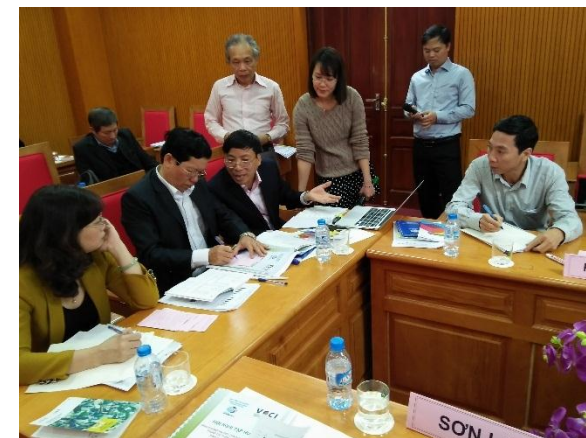
Quang cảnh lớp học