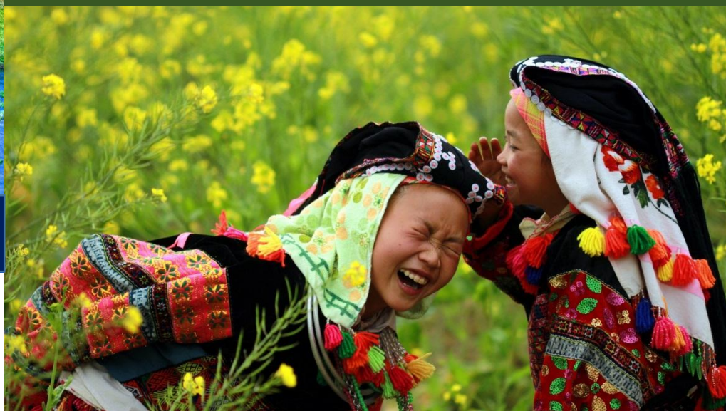
Hội nghị tập huấn PCI cho HĐND khu vực miền bắc tại Hà Giang (01/12/2016)