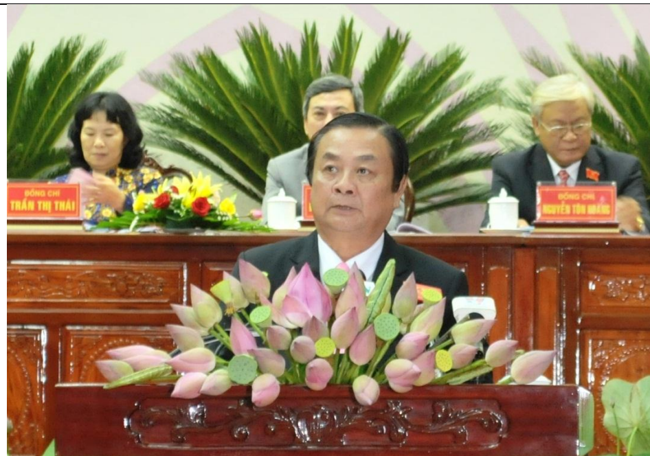
Bí thư Tỉnh ủy Đồng Tháp Lê Minh Hoan rất tâm huyết với việc xây dựng một chính quyền gần dân và cũng là một người bạn thân thiết đồng hành với doanh nghiệp