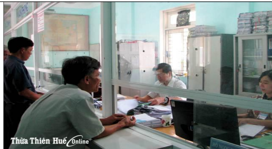
Giao dịch tại Phòng một cửa ở phường Tây Lộc - một trong những đơn vị đi đầu về cải cách hành chính của TP. Huế.