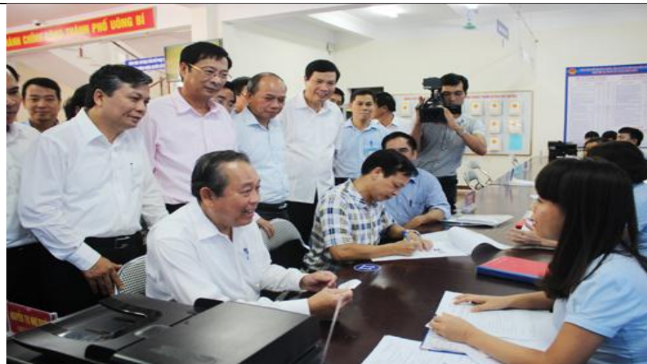
Đồng chí Trương Hòa Bình, Phó Thủ tướng Chính phủ đánh giá cao Quảng Ninh đã mạnh dạn thí điểm triển khai mô hình Trung tâm Hành chính công