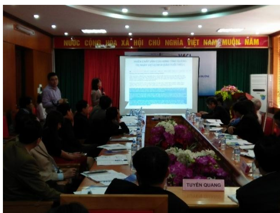
Quang cảnh lớp học

Cụ thể, tại Hội nghị, các chuyên gia cao cấp đã truyền đạt những nội dung chính như: Vai trò của