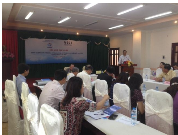
Hội nghị tập huấn tại Hậu Giang