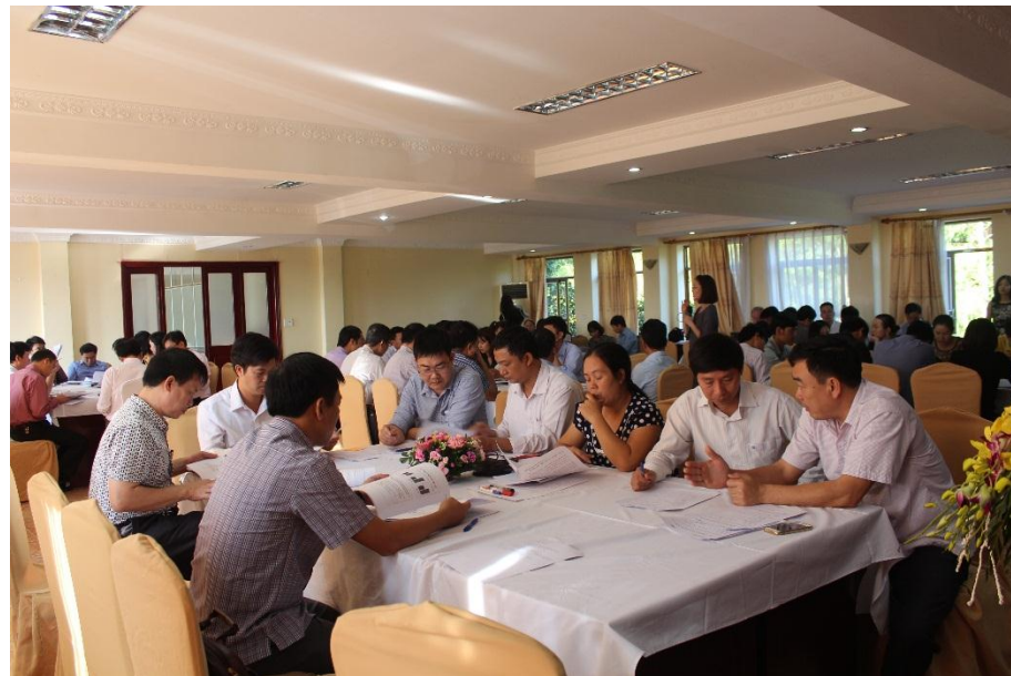
Quang cảnh Lớp Tập huấn

doanh nghiệp trong hoạch định chính sách, cải thiện môi trường đầu tư và những chuẩn mực trong việc vận động chính sách. Thông qua các thực tiễn tốt của các tuyên quang Bắc Ninh và chia sẻ của các chuyên gia, các học viên đã nắm và thực hiện khá tốt cách thức để tổ chức một cuộc đối thoại thành công nhằm tháo gỡ khó khăn vướng mắc cho doanh nghiệp.