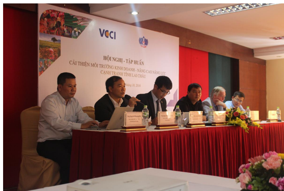
Bàn Chủ tọa Hội nghị

Hoạt động Hội nghị - Tập huấn: Cải thiện Môi trường kinh doanh nâng cao năng lực cạnh tranh Lai Châu, được thiết kế làm 2 phần: