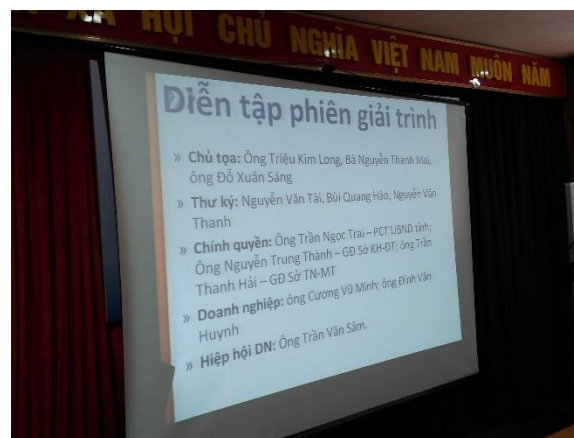
Thực hành bài tập phân vai

Bên cạnh đó, các đại biểu còn được thực hành diễn tập một phiên giải trình tại Hội đồng Nhân dân có sử dụng các thông tin dữ liệu bằng chứng từ PCI. Trong bài tập này, các học viên được phân vai theo các chức danh trong một phiên giải trình thực sự tại Hội đồng nhân dân như ban chủ tọa gồm có chủ tịch và các phó chủ tịch, thư ký phiên họp và các bên liên quan như đại diện UBND, doanh nghiệp hay hiệp hội có liên quan tham gia giải trình một vấn đề mà thường trực HĐND quan tâm. Việc thực hành bài tập cho thấy các học viên đã hiểu và biết cách sử dụng các dữ liệu từ PCI như một nguồn thông tin hữu ích cho các hoạt động của HĐND, biết cách phân tích, tổng hợp và sử dụng PCI phù hợp trong từng trường hợp cụ thể.