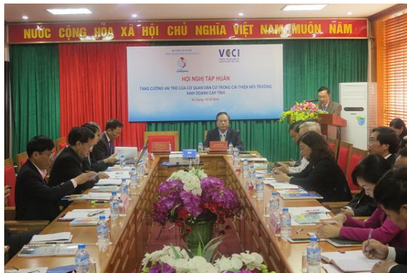
Hội nghị tập huấn tại Hà Giang

Mục tiêu của hai khóa tập huấn là nhằm tạo diễn đàn thảo luận dành cho các đại biểu dân cử trao đổi về thực tiễn cơ chế, chính sách trong thực hiện chức năng của mình, đặc biệt là áp dụng chỉ số PCI trong hoạt động xây dựng chính sách, giám sát việc thực hiện chính sách, để qua đó các đại biểu dân cử hiểu hơn về việc sử dụng PCI trong hoạt động của mình; thu thập các bài học, kinh nghiệm tốt từ các địa phương trong vùng, từ các chuyên gia về PCI trên toàn quốc.