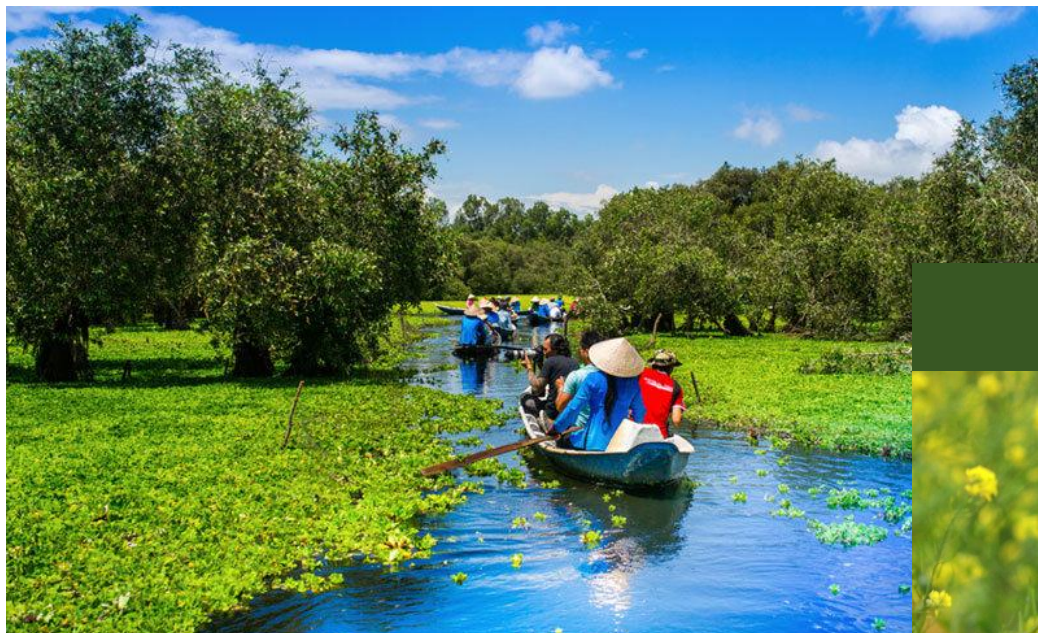
Hội nghị tập huấn PCI cho HĐND khu vực miền nam tại Hậu Giang (23/11/2016)